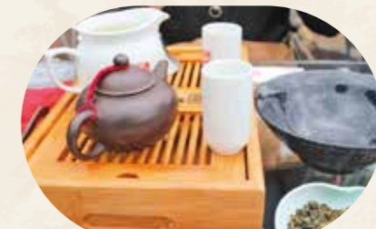
独自製法の台湾茶