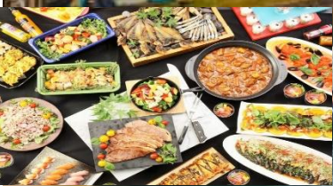
1日目夕食イメージ