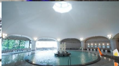
登別グランドホテル大浴場