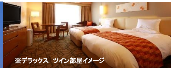
※デラックス ツイン部屋イメージ