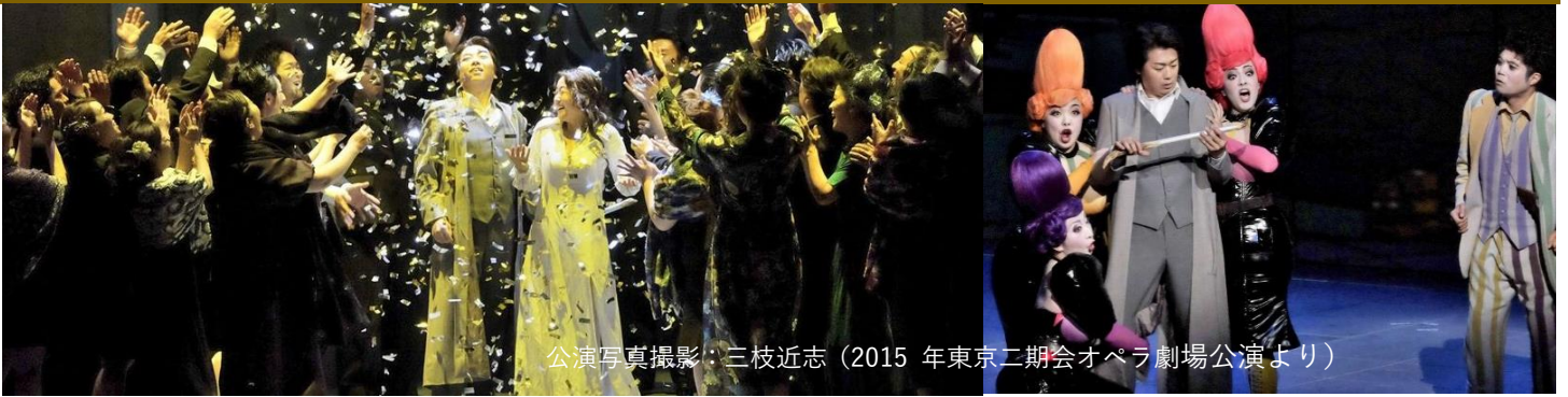
（2015年東京二期会オペラ劇場公演より）

世界の劇場に旋風を起こした、宮本亞門の「魔笛」が山形に！この秋、最高のオペラ体験を！